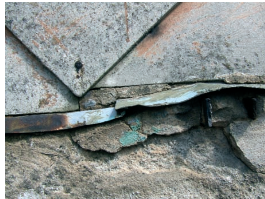
Płyty azbestowo-cementowe elewacyjne