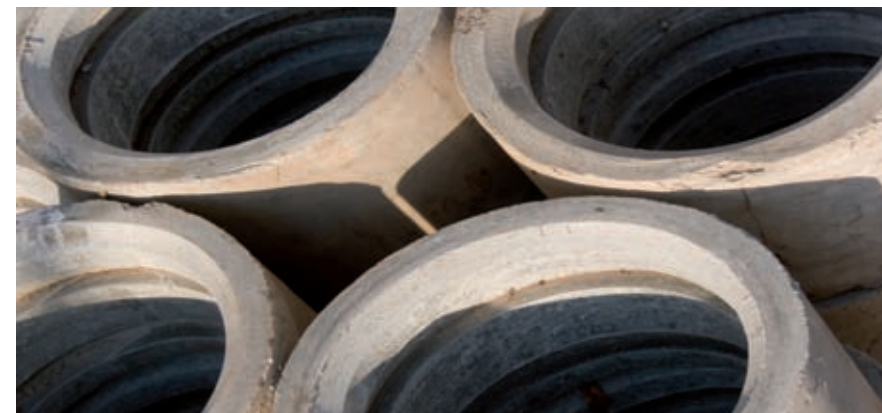
Rury zawierające azbest

Wyroby zawierające azbest klasyfikowane są w dwóch grupach, przyjmując jako kryterium m.in. procentową zawartości azbestu, stosowane spoiwo oraz gęstość objętościową wyrobu: