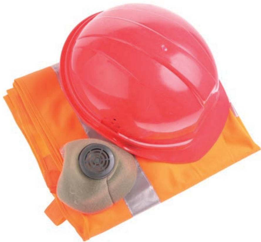
Środki ochrony indywidualnej

Prace polegające jedynie na wymianie pokrycia dachowego – bez dokonywania zmiany konstrukcji dachu podczas tych prac – wystarczy zgłosić do starostwa powiatowego (do urzędu miejskiego na prawach powiatu)