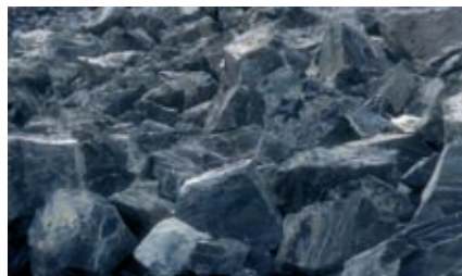
Azbest - minerał

Istnieje kilka odmian azbestu, różniącego się m.in. składem chemicznym oraz rodzajem włókien. Największe znaczenie przemysłowe w Polsce i około 95 % udział w ogólnej masie stosowanych minerałów azbestowych miał azbest biały (chryzotyl - uwodniony krzemian magnezu). Rzadziej stosowane, aczkolwiek dużo bardziej niebezpieczne dla zdrowia są: